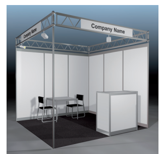
All-inclusive-Paket Easy 9 m 2