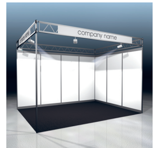
Modell Eco plus

Dienstleistungen: tägliche Standreinigung, Haftpflichtversicherung für die Messedauer, Versicherung des Ausstellungsgutes gegen Feuer, Blitzschlag, Explosion und Elementarschäden (max. Wert bis CHF 10 000), 4 Ausstellerkarten, Mediengrundpaket (Online und Print), 20 Gästekarten